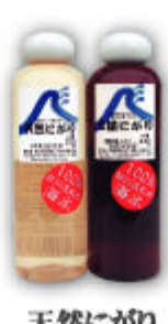
天然にがり 玉藻にがり