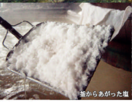
釜からあがった塩