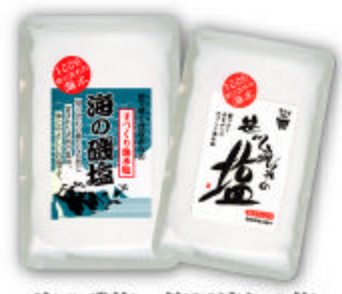
海の磯塩 笹川流れの塩